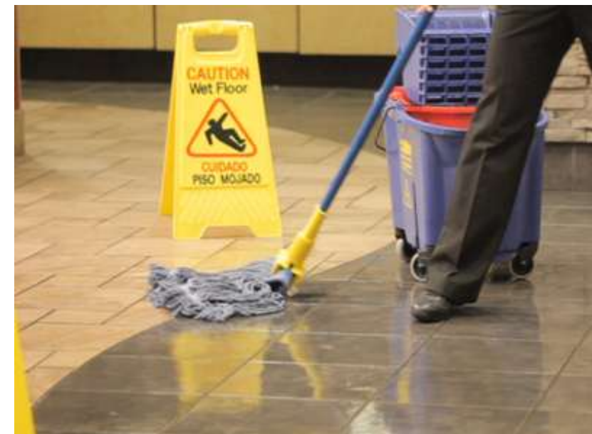
Своевременный клининг твердых поверхностей