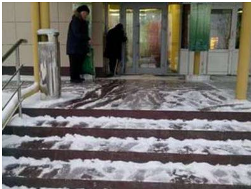
Грязезащита должна быть закреплена